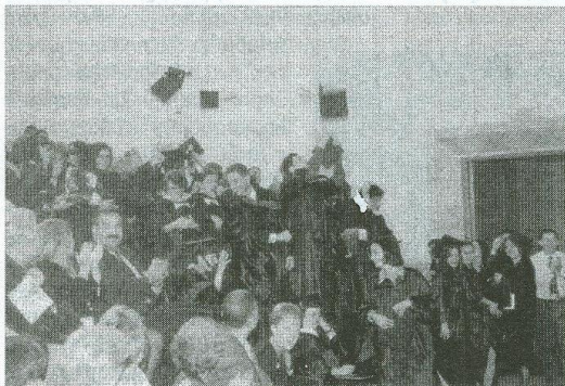
Ավարտական արարողություն. երկար սպասված պահը

ՀԱՀ Տեղեկատվության և հասարակության հետ կապերի բաժին