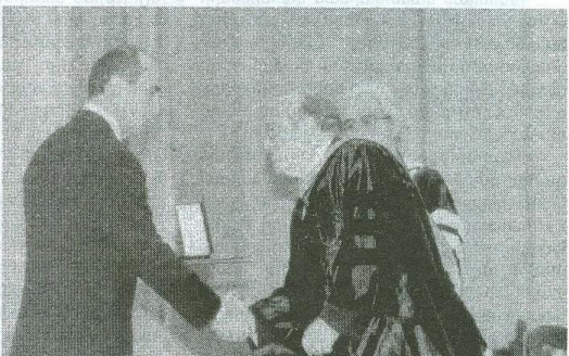
«Նախագահ Ռ. Քոչարյանը պարգևատրում է ՀԱՀ պատվավոր նախագահ Դր. Միհրան Աղաբաբյանին «Մովսես Խորենացու» մեդալով:

Ամենամյա ավանդույթ դարձած շրջանավարտների հավաք-ճաշկերույթը կայացավ հոկտեմբերի 5-ին «Վալենսիա» նորաբաց սրահում: Միջոցառումը յուրօրինակ ու մտերմիկ հանդիպում էր ՀԱՀ-ի տասը տարվա շրջանավարտների, որոնք հավաքվել էին միմյանց ծանոթանալու, սիրված բուհի 10-րդ տարեդարձը շնորհավորելու, ինչպես նաև հոբելյանական տոթը ճաշակելու: Միջոցառման ընթացքում Շրջանավարտների ասոցիացիայի պատվավոր անդամներ հռչակվեցին ՀԱՀ-ի հիմնադիրներ և մի շարք դասախոսներ: ՀԱՀ-ի շրջանավարտներից շատերն այժմ