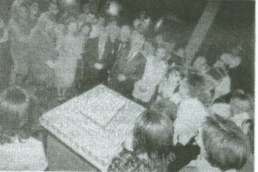
Հին և նոր շրջանավարտների հավաք-ճաշկերույթի ժամանակ

Ամենամյա ավանդույթ դարձած շրջանավարտների հավաք-ճաշկերույթը կայացավ հոկտեմբերի 5-ին «Վալենսիա» նորաբաց սրահում: Միջոցառումը յուրօրինակ ու մտերմիկ հանդիպում էր ՀԱՀ-ի տասը տարվա շրջանավարտների, որոնք հավաքվել էին միմյանց ծանոթանալու, սիրված բուհի 10-րդ տարեդարձը շնորհավորելու, ինչպես նաև հոբելյանական տոթը ճաշակելու: Միջոցառման ընթացքում Շրջանավարտների ասոցիացիայի պատվավոր անդամներ հռչակվեցին ՀԱՀ-ի հիմնադիրներ և մի շարք դասախոսներ: ՀԱՀ-ի շրջանավարտներից շատերն այժմ