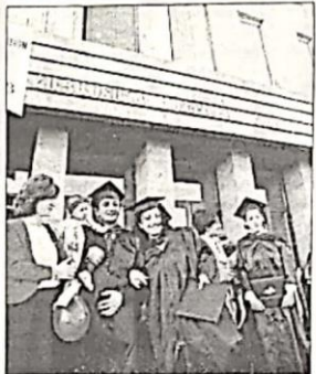
ՀԱՀ ուսանողներն ակարտական հանդիսությունից հետո

Հայաստանի Ամերիկյան համալսարանը (ՀԱՀ) շարունակում է բարձրագույն կրթության բնագավառում աննախադեղ հնաարավորություն ըննենել ուսանողներին տղիերու Մագիստրի կոչում շնորհող գործարար ղեկավարում, մասնագիտություն, իրականություն, համրային առողադադություն, կարաակադեություն և միջազգային հարաբերություններ, և տրակալ միջակայի դաստիարակություն բարձրություն 2001 թվականից սկսած դասն գրամարկց նախ հանակարգային և ինժոնեարի գիտությունների բնագավառում Մագիստրի աշխատանք շնորհող ծագից: Առ այստ ՀԱՀ-ը ակարել են ակնի հան 1500 տրակակալներ, որոնցից շատերն առաջ հաջողության են հասել իրենց ընտան աշխատանքային գործունեության ադյաբեզում շնորհիվ արեանյան կրթական համակարգի հեռ ծառայություն և մասնագիտական ուսումնադության: ՀԱՀ-ի երեակյա տարեկան տղիում են տարեկան տար 400 ուսանողներ: